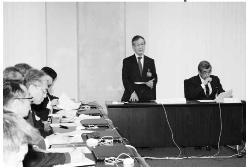
まん延防止対策などについて協議する感染症対策本部会議