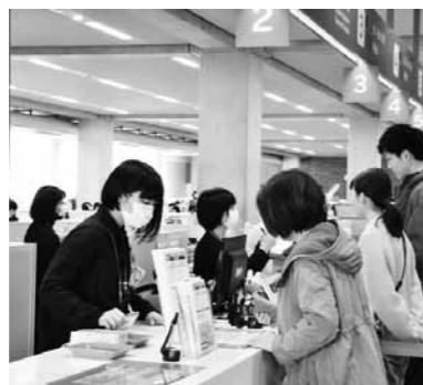
マスクを着用して業務にあたる職員