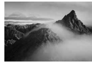
清朝の槍ヶ岳