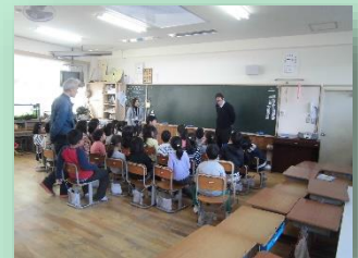
楽しみながらの英語学習（小学校）

児童・生徒の国際的視野の育成とコミュニケーション能力の素地を養うため、市内小・中学校に外国語指導助手を配置しました。これにより、小学校では、英語に対するつまづきや抵抗を感じないように、楽しみながらの授業ができました。また、中学校では、「聞く」「話す」といったコミュニケーションの基礎となる部分への取り組みが強化され、課外授業においてはさらに学習意欲のある生徒に応えられる体制ができました。