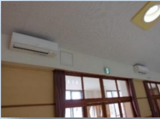
市内認定こども園に設置したエアコン

避暑地として知られる安曇野市も、近年は猛暑日が続きます。猛暑日でも子どもたちが健康で安全に過ごせるよう、公立認定こども園や幼稚園の遊戯室にエアコンを設置しました。また、冬場の暖房にも使えるため、既存の石油暖房機と併用することで環境負荷の軽減も図ります。（基金を活用し、小学校教室へのエアコン設置も進めています。）