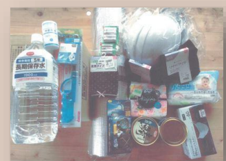
市民が購入した防災用品の一例

災害が発生した時に市民の生命を守るためには、自助・共助・公助の機能が十分に発揮できる体制づくりが大切です。市民の災害の備えの拡充を図るため、市民の防災用品の購入に対して補助金を交付しました。また、第3次長野県地震被害想定調査報告書を参考に定めた備蓄計画に基づき、市の備蓄品として、食料・飲料水・日用品、資機材等を購入しました。