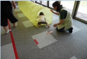
サーキット遊び「遊びの教室」の一場面

発達に心配のあるお子さん及びそのご家族に対し、子どもの最善の育ちを支援しました。早期発見、早期療育を目指し、0歳～2歳くらいの個別療育「はいはいたっちの相談日」や、未就園児の小集団の療育「遊びの教室」を開催しました。保護者がお子さんとの関りを学び、安心して子育てができるよう、支援を充実させていきます。