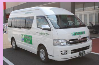
市内で 14 台運行しています。

自宅から目的地までをドアトゥドアで送迎する、予約型乗り合いタクシー「デマンド交通あづみん」の運行により、交通弱者の移動手段を確保しました。平成 30 年度は運転免許を持たない方、または、運転免許証を返納された高齢者や障がい者を中心に、身近な移動手段として年間 86,273 人の方にご利用いただきました。低料金で、自宅前まで迎えに来てくれるという利便性が評価されています。