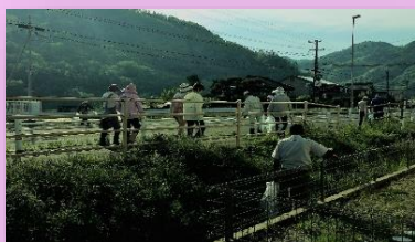
地域で取り組まれた一斉清掃活動の様子

地域の清掃活動への取り組みや指定集積場所の維持管理に対する支援を行うため、各自治会等へ交付金を交付しました。各自治会等の環境活動を支援することで、地域主導の清掃活動が行われ、ごみの分別や資源化の市民意識向上と、生活環境の保全が図られました。