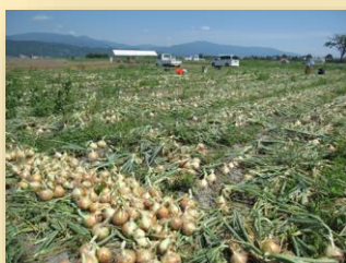
畑で収穫されたばかりの玉ねぎ

安曇野を創る農業と、豊かな農地を保全していくため、安曇野市の地味・気候等に適 した「玉ねぎ・ジュース用トマト・黒大豆」の産地化に取り組みました。甘くておいしい「安 曇野産玉ねぎ」として評判を得ています。今後もさらなる産地化を目指すとともに、安 曇野の豊かな農地の保全にも努めていきます。