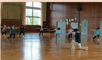
健康づくり活動を行う団体の様子

平成 30 年度から、健康増進や介護予防のために定期的に健康づくりの活動を行う 高齢者の自主活動団体への補助金交付事業を始めました。補助金をきっかけに活 動を始める団体もあるなど好評をいただき、平成 30 年度は 72 団体に補助を行いま した。今後も事業を継続し、高齢者の生きがいと健康づくりにつなげていきます。