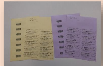
交付した入浴料金割引券

外出支援事業の一環として、70 歳以上の方や一定の障がいがある方に対して、市 内の入浴施設約 20 カ所で利用できる入浴割引券を年間 24 枚交付しました。多く の方にご利用いただき、高齢者や障がい者の皆さんの外出のきっかけとなりました。