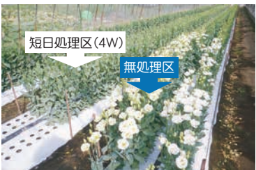
【試験圃場】撮影9/2 短日処理により開花抑制

「短日処理」は、7月下旬定植後に約4週間、専用資材を被覆して、9～10時間日長（14～15時間の夜）としたところ、無処理に比べて草丈が長く、枝数や輪数の多い、ポリウムのある切花が得