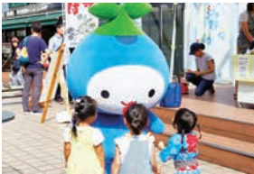
安曇野の農産物を応援するキャラクター「みずん」もPR