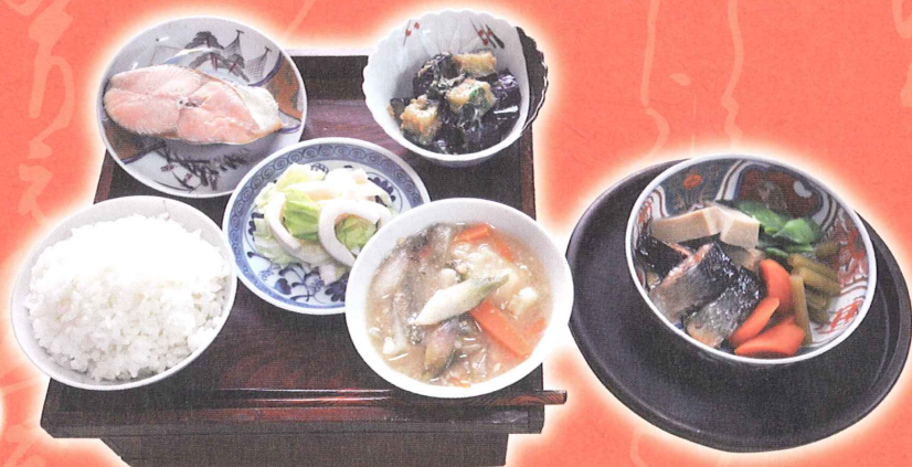
昭和30年代 ある夏の夕食

主催 安曇野市豊科郷土博物館 共催 安曇野市商工会・安曇野市商工会観光特産飲食部会