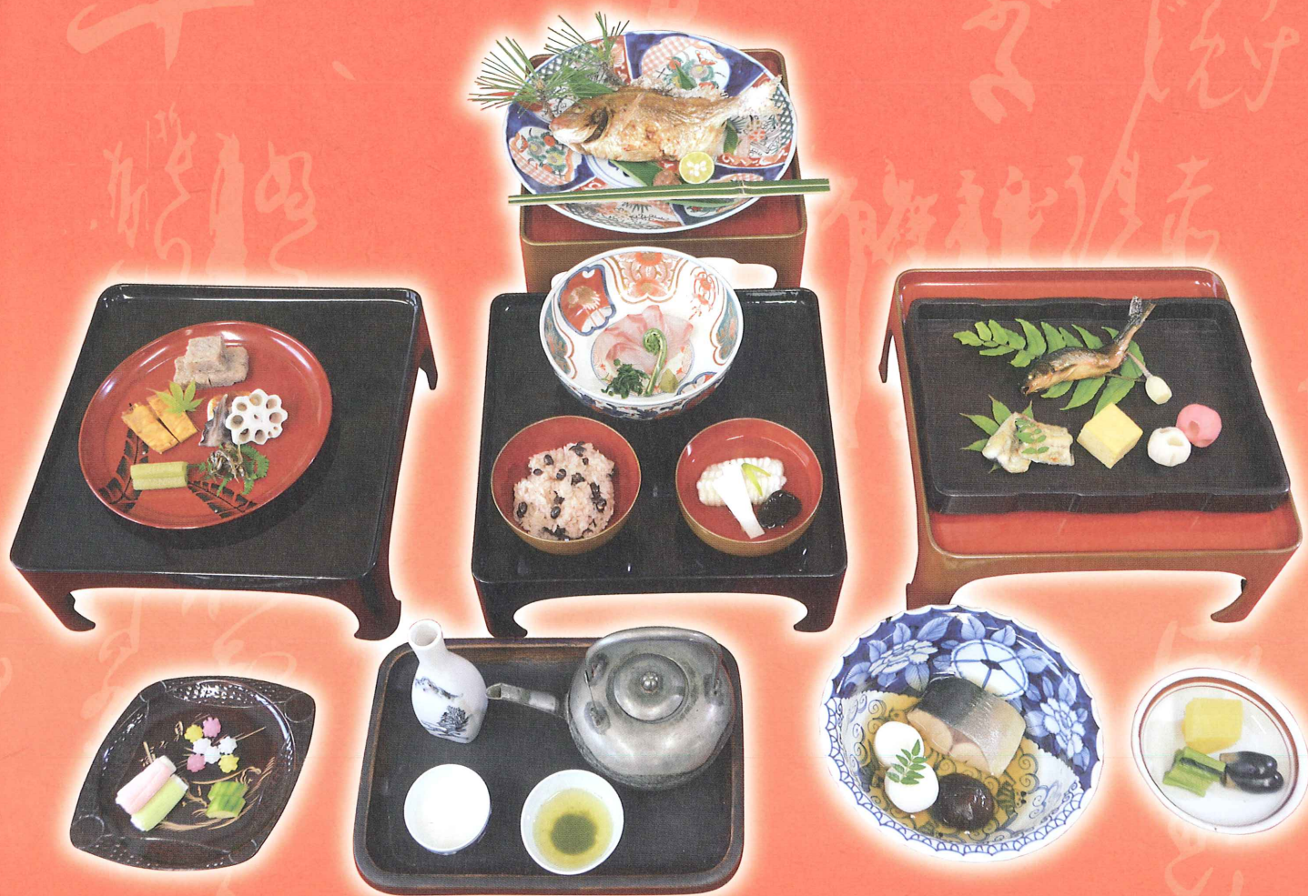
江戸時代 貞姫のおもてなし膳