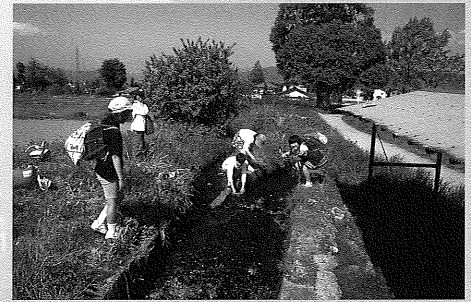
穂高・柏原 1990年代前半

「安曇野」と言われて、どんな風景を思い浮かべますでしょうか。雪を頂いた常念岳をバックにたたずむ道祖神、安曇野を縦横に流れる無数の堰、清冽な湧水をたたえる万水川…。周囲の山々の頂きに立てば、水田が一面に広がる田園風景が眼下に見えてくることでしょう。