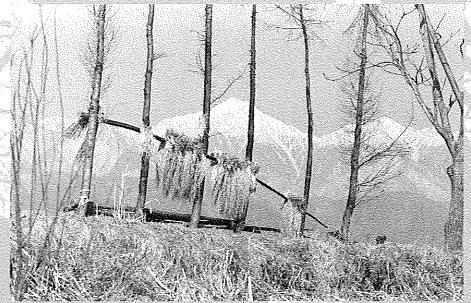
三郷明盛・一日市場 1970年頃