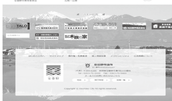
新ホームページのトップページ