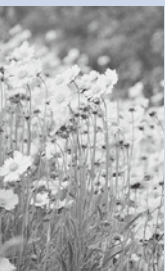
オオキンケイギク