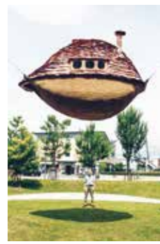
△藤森照信『空飛ぶ泥舟』