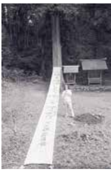
△松澤 宥 『御射山奥社密儀』