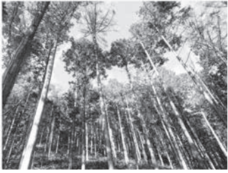
堀金烏川市有林のヒノキ、カラマツ

答 伐採、運搬のための作業道等も整備しなければならず、木材の売上でそれら経費を賄うのは難しい。市有林の材木の売上げで市の財源を潤すことは厳しいが、利用先が見つかった場合には市有林を中心として材を確保していく計画である。