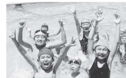
学校プールに響く歓声