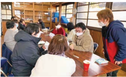
公民館にて 子育て・教育について意見交換

生活に直結する新鮮な情報発信があれば、安曇野の未来を背負う若者も市政に意見や提案をしやすい環境になります。議会だよりはそのための情報源として十分活用できるものであって欲しいです。