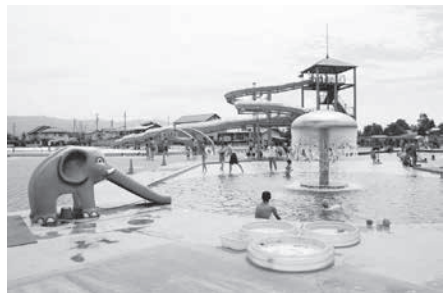
廃止が決まった穂高プール

※一般質問の詳細は、安曇野市議会ホームページまたは図書館に会議録があります。ご覧ください。(会議録作成には定例会から2カ月ほどかかりますのでご了承ください。)