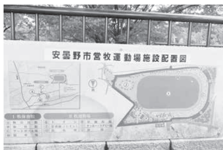
更なるスポーツ拠点として期待する牧運動場