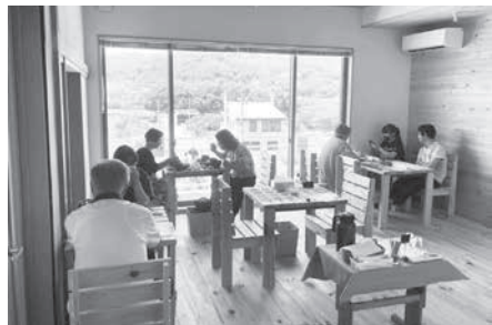
空き家活用×地域づくりのモデル例 ~明科の龍門涸らす~

問 令和7年度までに部長、課長職の女性職員の割合を15%にする目標について伺う。