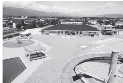
廃止が確定し解体工事を待つ穂高プール

今や野球の審判でさえビデオ判定する時代だ。自分たちが決めたことをもう一度振り返ることも必要だ。