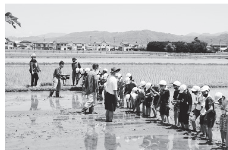
コミュニティスクール事業の様子 (小学5年生の田植え)

市長 市民の皆さんの交流が持続し、次世代を担う子どもたちがお互いの自治体を知り合って、交流がより活発になることを願う。