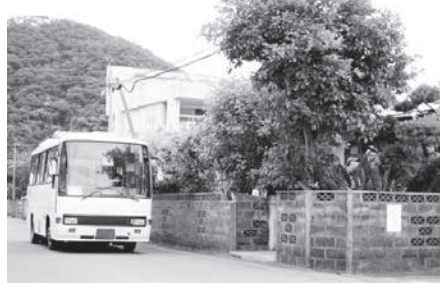
13人乗りで初期費用・運行費の軽減が図れる