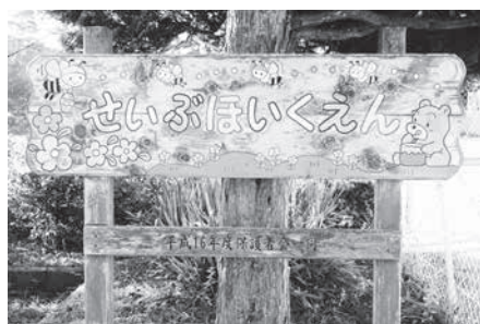
三郷西部認定こども園の保護者手作り看板

○その他の質問事項 ○市内高校の再編問題、臭気対策 ○消防団員報酬費、凍霜害と畜産振興 ○加齢性難聴と聴覚情報処理障害問題