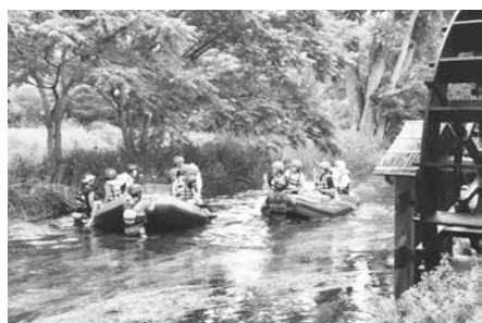
川面に響く子どもたちのラフティング体験

問 安曇野の水環境の魅力を味わうラフティング体験は、市民の関心が高かった。市民の関心をどのように見て、どのような展開にするのか、今後に生かすのか。また、共