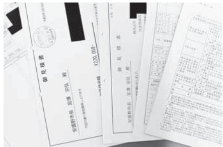
仕様書なく取り寄せた見積書と関係書類

問 調査の基本となる仕様書を3者に提示して見積りを取らない限り、適正な調査はできない。談合や不正