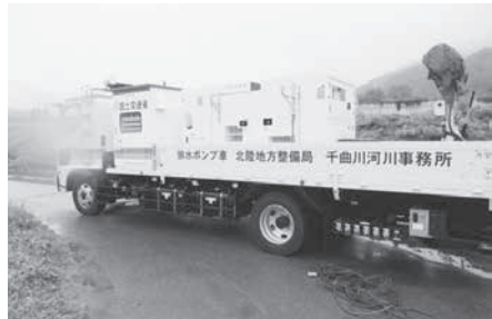
今回稼働した国土交通省の排水ポンプ車

※DX：デジタル・トランスフォーメーションの略。進化するデジタル技術とデータを駆使し、地域交通、医療、教育などさまざまな分野で人々の生活をより良くするもの。