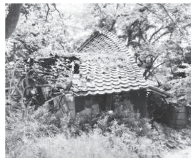
草木が繁茂する空き家