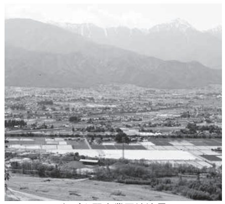
あづみ野産業団地遠景

問 令和2年度決算の実質単年度収支が約1億1457万円の赤字だが財政上の不安材料ではないのか。 答 赤字の要因は産業団地造成のための財政調整基金の取り崩し。一時的な収支のやりくりの結果で財政状況を判断するものではなく、参考値の一つ。