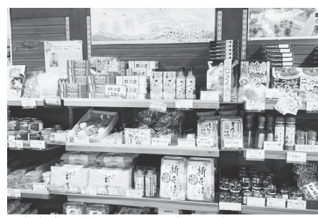
東金市の道の駅にある安曇野産品コーナー