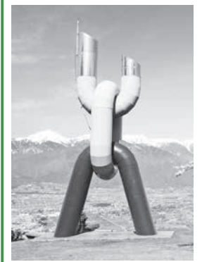
長峰山の歴史の塔

問 長峰山のタイムカプセルは、掘り出した後はどうするのか。歴史の塔が傷つくことはないのか。 答 1971年当時の明南小学校と明北小学校の6年生の作文等が入ったタイムカプセルの50年後の開封で、歴史の塔の基礎部分のコンクリートの横から取り出す。作文は個人に返却し、必要なものは管理保管をしていく予定。