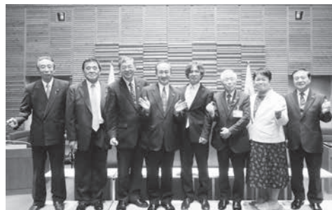
議会改革推進委員会メンバー

なお、議会改革推進委員会は、議会基本条例の全条項の検証見直しを行い、条例改正を実現しました。その他、安曇野市議会政策提案及び政策提言実施要綱を策定し、市議会から市行政への政策提言の道筋を確かなものとし、政策提言を実現しました。