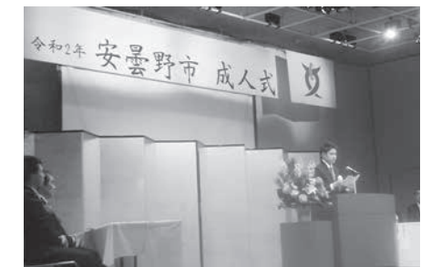
令和2年1月の成人式の様子

建設 令和3年度から用地交渉と工事発注担当者に分ける体制にし、用地交渉の経験豊富な職員を配置した。