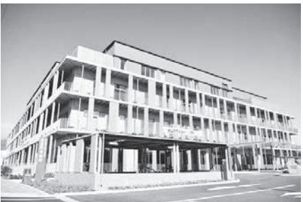
安曇野市役所本庁舎

豊科総合支所等整備検討市民会議でトイレ設置を望む声はなかった。今後、公衆トイレの要望があれば公衆衛生上の必要性等を考慮し、災害時のトイレ確保が大切なので検討する。