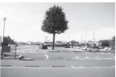
豊科公民館駐車場

※一般質問の詳細は、安曇野市議会ホームページまたは図書館に会議録があります。ご覧ください。(会議録作成には定例会から2カ月ほどかかりますのでご了承ください。)