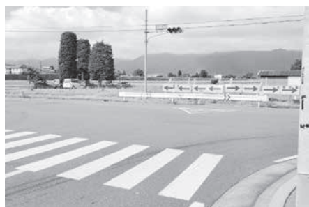
早期建設が望まれる 147号バイパス先線

市長 高家バイパス拾ヶ堰北交差点から西へ向けての道路については、県の交通量調査において渋滞緩和につながらないと位置づけられた。西部地域の発展には欠かせない道路になると思われることから、次期市長へ申し送りしたい。