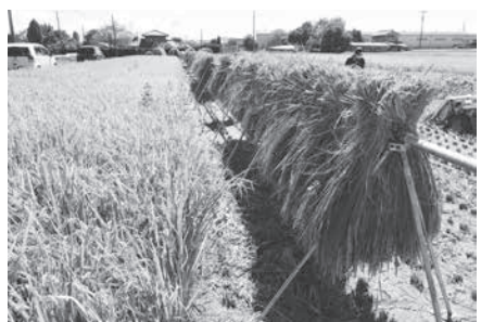
安曇野の実りの秋