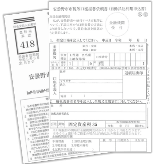
△はがきタイプの「市税等口座振替依頼書」

第18回あづみの公園 早春賦音楽祭 公募ステージ出演者 第18回あづみの公園早春賦音楽祭の公募ステージ出演者を募集します。 5月4日(水) 園管アルプスあづみの公園(堀金・穂高地区) アプロ・アマ・ジャンル問わずどなたでも 1グループ2000円(小中高生のみグループは無料) 4月8日(金)までに申込書にデモテープを添えてアルプスあづみの公園管理センターへ郵送。 〒399-8295(住所不要)「あづみの公園早春賦音楽祭」係 宛 岡文化課 71・2463 ID 51298