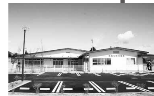
しゅん工した穂高北部児童館

昭和50年に建てられた旧児童館は老朽化し、耐震にも課題があったこと、また放課後児童クラブの受け入れ拡大ニーズに対応するには、施設が手狭になっていました。