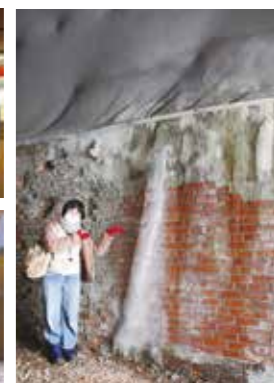
自然の遊び場を発信

援課でも職員の熱意と、困ったときにも親身になってくれるバックアップ体制もありがたいと言います。