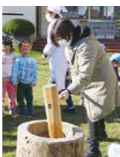
子どもたちと餅つき

2人の協力隊により、「あづみの自然保育」の魅力はこれから全国に発信されます。2人が奔走する自然保育の「安曇野モデル」に今後も注目ください。