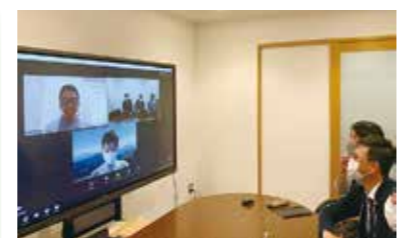
コロナ禍でのオンライン打ち合わせ