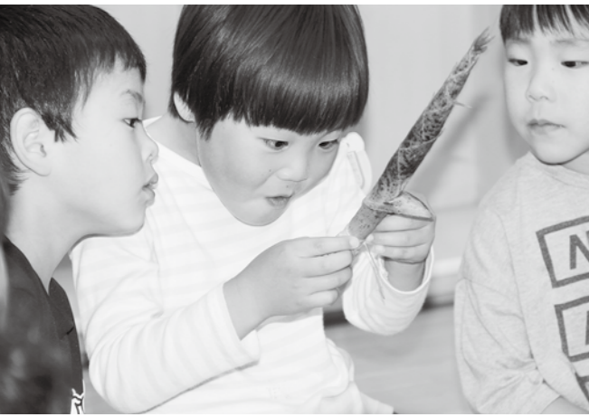
本物に触れることで、好奇心や意欲につながります