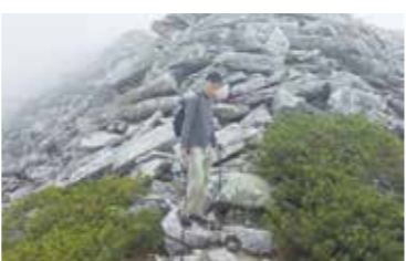
前常念避難小屋・巻道の現地確認