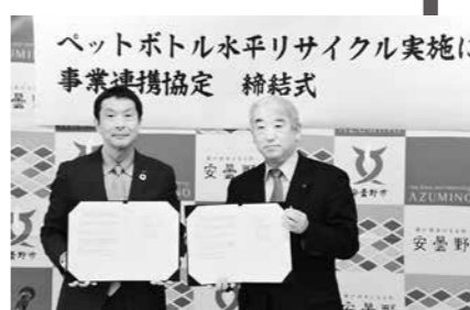
協定書を掲げる澤田工場長（左）と太田市長（右）

万本のうち約113万本が水平リサイクルされる見込みです。太田市長は「豊かな自然を次代につなぐため、市民の皆さんとリサイクル推進に取り組みたい」と話しました。