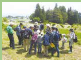
令和元年5月の観察会の様子