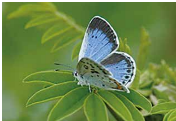
「クララ」にとまるオオルリシジミ