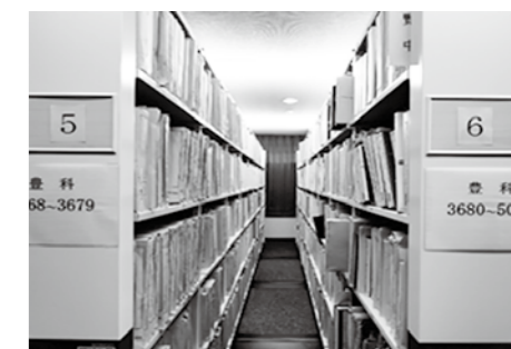
文書館に集約された歴史的資料

世から現代に至る多くの歴史的資料の活用が可能になるなど、新しく市誌編さんを進める条件が整ってきました。 今後、市誌の調査などで得られた話題などをこのコーナーに掲載していきます。どうぞお楽しみに。