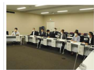
オンライン視察の様子