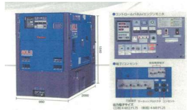
リースする排水用発電機