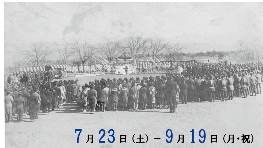
堀金国民学校校庭での戦死者の村葬