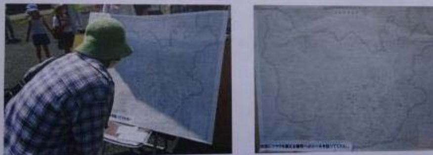
苗の配布時に植栽場所にマーキング