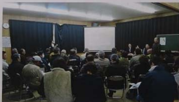
岩原区公民館にて