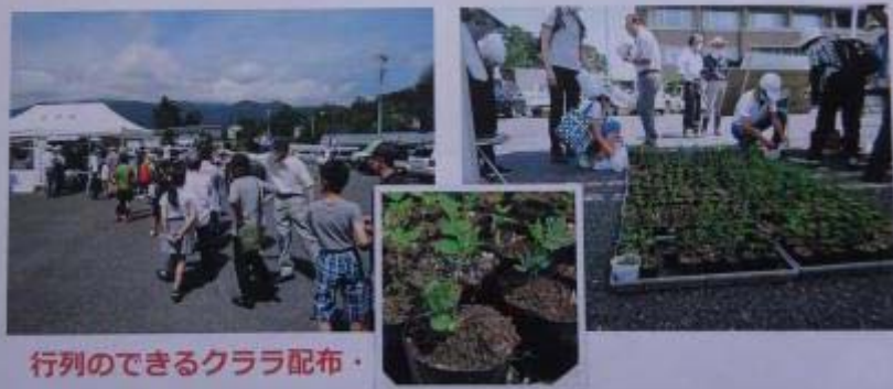
行列のできるクララ配布・