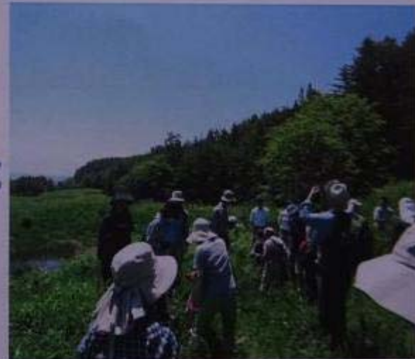
国営アルプスあづみの公園内の 保護区での観察会