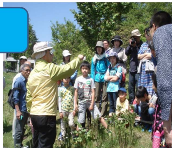
サナギを公園内で放すイベントの様子