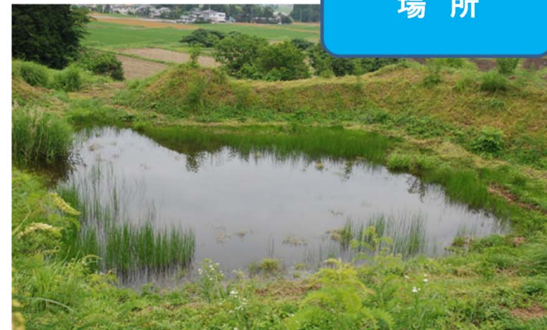
サンクチュアリ全景