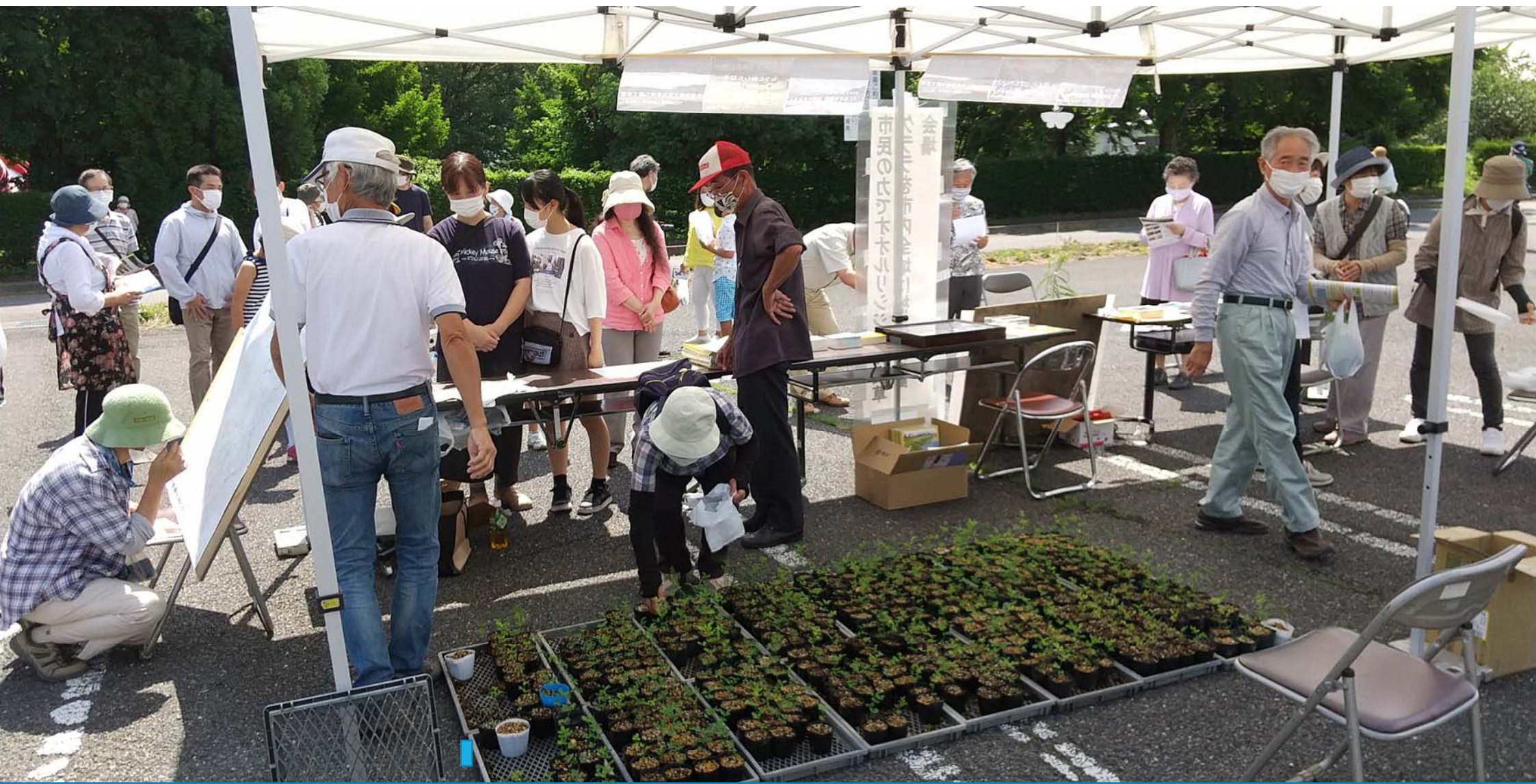
みんなでクララ苗を市内に配るイベントをはじめ