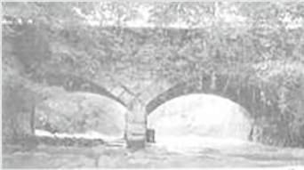
▲崩壊前のめがね橋

豪雨の影響で万水川をまたぎ矢原堰の水路を支えてきた「めがね橋」が崩壊。また、烏川富田橋下流の堤防が崩落するなど大きな被害が発生しました。