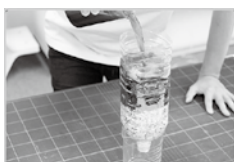
手づくりろ過装置