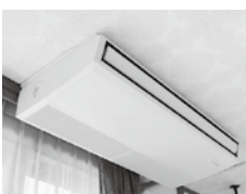
上鳥羽地区公民館に設置されたエアコン