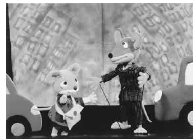
HOBO'S PUPPET THEATER