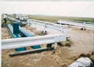
▲大雨で警戒水位を越水した水路

豊科田沢で国道19号の路肩が崩壊。明科地域では警戒水位を突破し、床上浸水13世帯、床下浸水72世帯、穂高地域でも床下浸水33世帯の被害が発生しました。