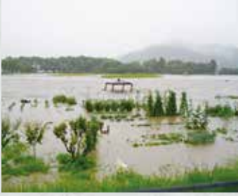
冠水した明科御宝田遊水池

梅雨前線の長雨により、市内全域で道路の冠水や林道の土砂崩落などの被害が発生。明科地域（小泉・荻原・木戸地区28世帯・88人に避難勧告。大雨により中房線、国道403号が通行止めになりました。