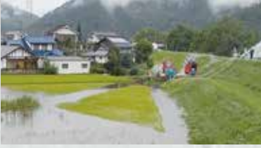
▲内水氾濫を排水する市消防団

前線の影響で記録的大雨となり明科地域の一部に「緊急安全確保」が発令され、内水氾濫や林道の崩落などの被害が発生しました。