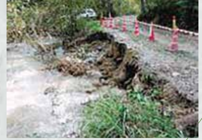
▲豪雨により浸食した道路

明科地域では、総雨量161ミリを記録。床下浸水、国道403号で土砂崩落が発生しました。穂高地域では、小岩嶽地区50世帯に避難勧告が出されました。