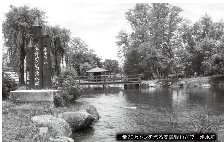
日量70万トン誇る安曇野わさび田湧水群

●環境フェアの詳細は市ホームページ内「安曇野エコプラン.net」ID 67663でご確認いただけます。