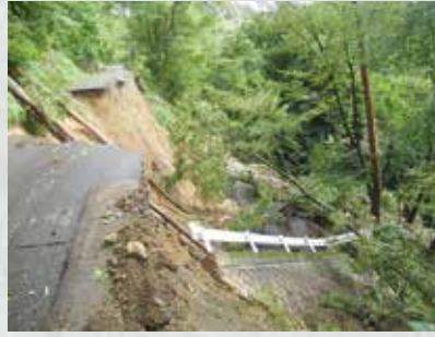
▲崩落した林道城山線