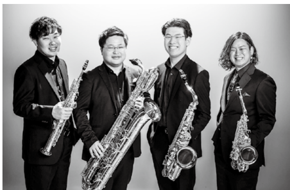
モデトロ・サクソフォン・アンサンブル