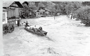
▲明科地域の会田川増水の様子

戦後最大の洪水となり、県内の被害は死者71人、家屋の全壊1,391世帯、床下浸水10,959世帯に達しました。