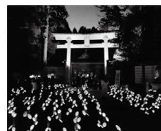
昨年(第10回)の神竹灯の様子

大分県竹田市から贈られた約1万本の竹灯籠に灯りがともり、神秘的・幻想的な世界に誘います。期間中は「あづみ野ぶちてらす」も同時開催。キッチンカーやクラフトなどが出店します。 12月2日(金)~4日(日) 9日(金)・10日(土)・16日(金)・17日(土) ▽神竹灯:午後4時~8時