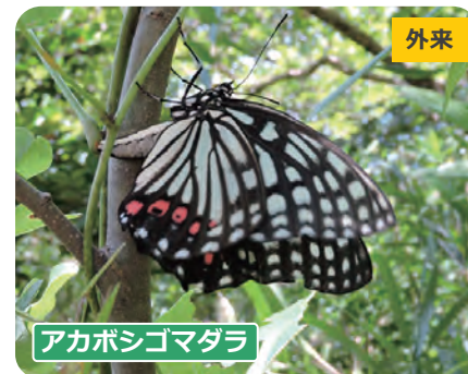
アカボシゴマダラ