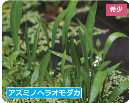
アズミノヘラオモダカ