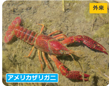
アメリカザリガニ

水田の減少で、数を減らしていると考えられます。また、近縁種との交雑も進んでいます。