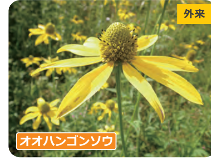
オオハンゴンソウ