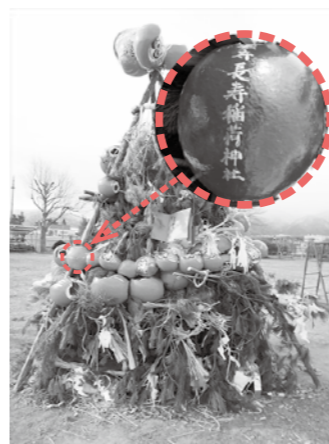
一日市場の三九郎に飾られただるま

安曇野市内でも、信仰されている神社やお寺には地域ごとに傾向がみられます。安曇野市誌の編さんのための民俗調査では、聞き取りやアンケート等を行っていますが、これには大変な時間がかかります。 そんな時、三九郎のヤグラを観察してみると一つの手段です。家々でおまつりされたお札や達磨が飾られ、地域の人々がどんな社寺を信仰しているか読み取ることが出来ます。例えば、一日市場の三九郎には「堀守長寿稲荷神社」と書かれた達磨がたくさん飾られていました。一日市場の南に位置する祠です。 毎年恒例行事である三九郎のような、私たちが当たり前だと思っているものも、見方を変えれば地域の文化を物語る宝庫になるといえるでしょう。