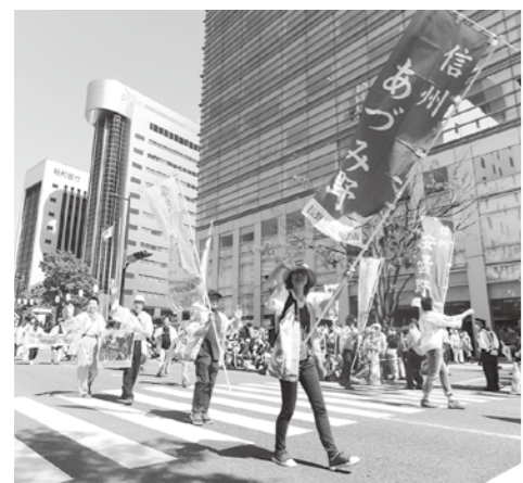
令和元年開催の様子

友好交流都市・福岡市東区を訪れ、安曇野市どんたく隊として安曇野市をPRしていただく皆さんを募集します。 ⑩5月2日（火）～4日（木） 行程 ▼2日：名古屋空港→福岡空港→東区ゆかりの地見学（志賀海神社など） ▼3日：博多どんたく港まつりパレード参加→市内観光 ▼4日：太宰府天満宮見学→福岡空港→信州まつもと空港 宿泊 浜の町病院前エスビーホテル（シングルルーム） ⑪20歳以上の市内在住者・在勤者 ⑫費用1人4万5000円（最終日の昼食