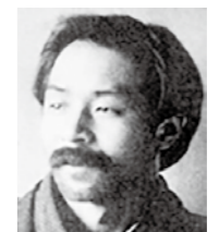
おぎわら もりえ 荻原 守衛

その後、パリ滞在中に見たロダンの 「考える人」を見て「初めて芸術 の威厳に打たれ、美の神聖なるを覚 知して茲に彫刻家にならうと決心し た」と記述されています。 そして、絵を学ぶため21歳で渡米。 その後、パリ滞在中に見たロダンの 「考える人」を見て「初めて芸術 の威厳に打たれ、美の神聖なるを覚 知して茲に彫刻家にならうと決心し た」と記述されています。 そして、絵を学ぶため21歳で渡米。 その後、パリ滞在中に見たロダンの 「考える人」を見て「初めて芸術 の威厳に打たれ、美の神聖なるを覚 知して茲に彫刻家にならうと決心し た」と記述されています。