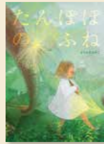
デビュー作 「たんぼのふね」 2023年3月に新装版として世界文化社より刊行