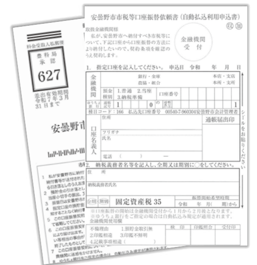
△はがきタイプの「市税等口座振替依頼書」