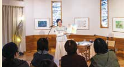
▲絵本原画展・朗読会 (絵本美術館 森のおうち)