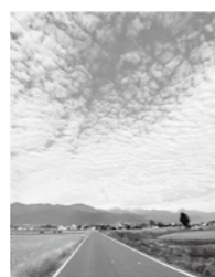
カントリーロード(中国・ガンブへさん)

県の多文化共生推進月間に合わせ、外国人県民から見た長野県の魅力を写した写真展とパネル展を開催します。