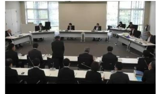
6月定例会総務環境委員会の録画中継

市民からの陳情を機に、ハラスメントの防止や発生した場合の対処などを明文化する予定です。