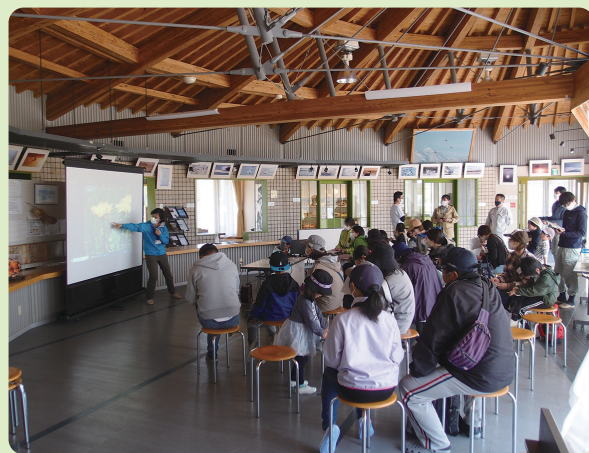
野外で見た生きもののふり返り