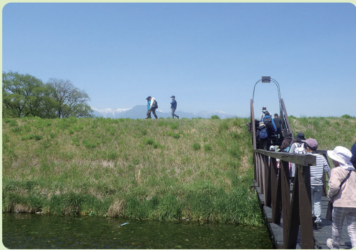
野外実習へ向かうようす

講座の後は、野外で実際に生きものを観察しました。講師の先生からは生きものの特徴や見分ける時のポイント、名前の由来などを教えていただきました。