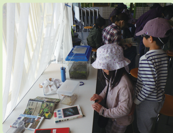
生きものの展示に興味津々