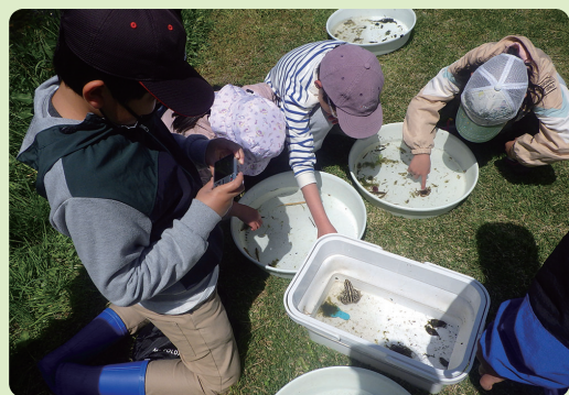
みんなで生きものの特徴を観察しました