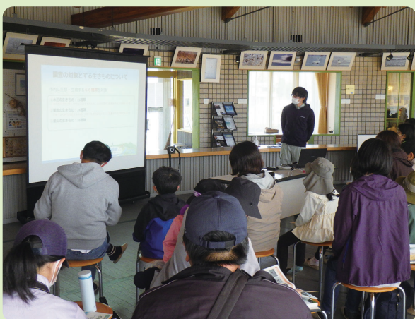
調査の方法を学ぶようす