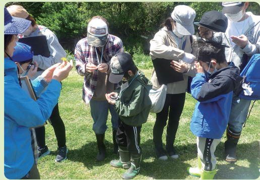
ルーペの使い方を学びました