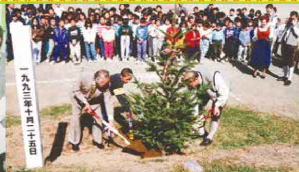
一九九三年十月二十五日