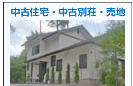
P125 E-1、P136 B-3