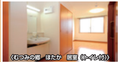
〈むつみの郷 ほたか 居室 (トイレ付)〉