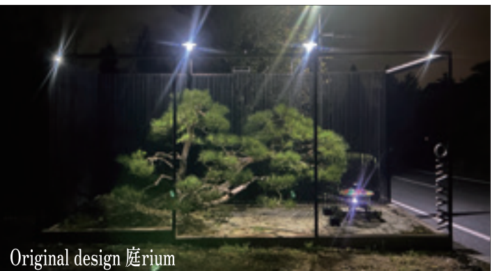
Original design 庭rium