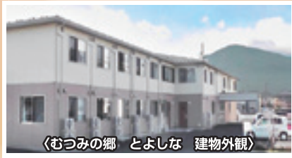
〈むつみの郷 とよしな 建物外観〉