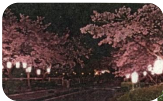
あやめ公園、龍門淵公園 桜(見頃:4月) 花菖蒲(見頃:6月)