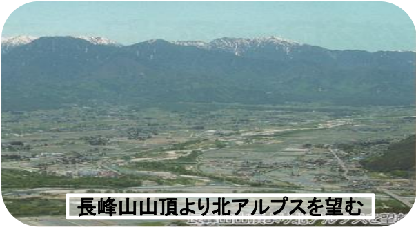
長峰山山頂より北アルプスを望む