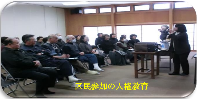
区民参加の人権教育