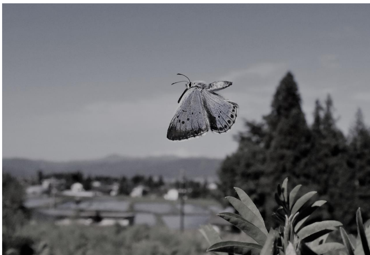
安曇野のオオルリシジミ（市天然記念物）