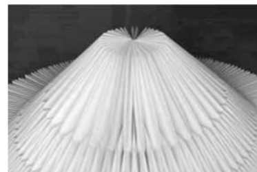
作品「無限折りより」