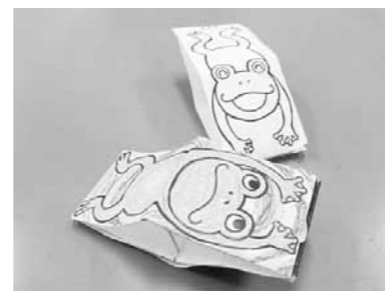
びよんびよんがえる

申4月12日(火)から電話または中央図書館カウンターに直接申し込みください。(受付時間は午前9時～午後5時)