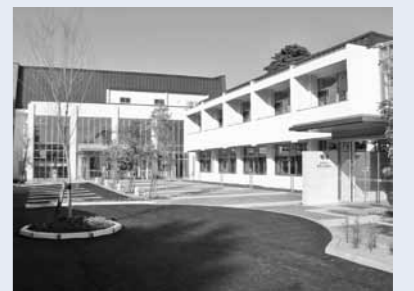
改修後の豊科公民館・大ホールの外観

平成26年11月から始まった大規模改修工事が完了し、豊科公民館および大ホールが4月にリニューアルオープンしました。会議室などの予約・使用については、豊科公民館へ問い合わせください。