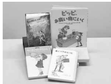
ピッピと北欧文学