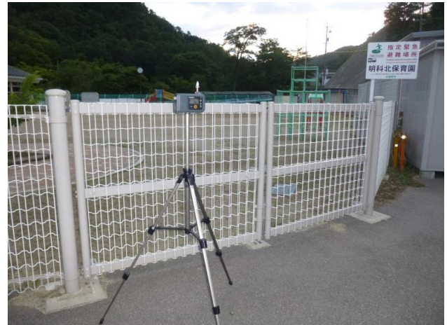
調査地点No.2 明科北保育園 散布中捕集 6月26日 4:37