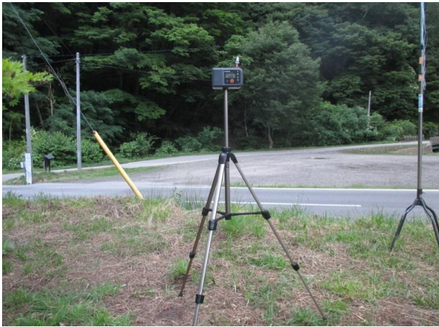
調査地点No.1 民家駐車場 散布中捕集 6月26日 4:40