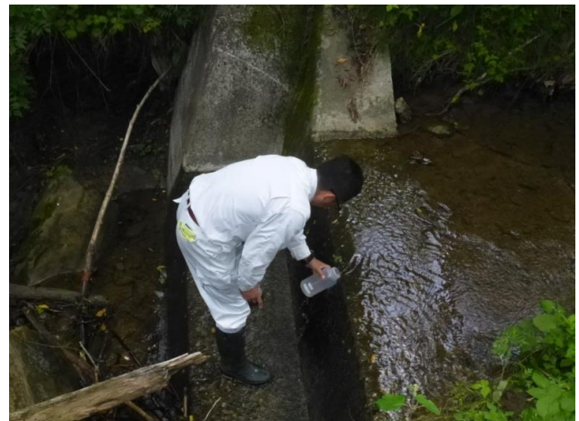
河川採水 6月26日 5:40