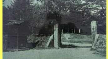
昭和20年当時の有明演習地兵舎正門

戦後の開拓により演習地は畑や田にかわり、今では豊かな農業地域や住宅地、山麓地域は穂高温泉郷として観光地に一変し、有明演習地の面影はありません。