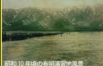
昭和10年頃の有明演習地風景

大正4年から昭和20年の終戦まで、有明村富田南原(現在の穂高有明)の一部桑畑・山蚕林を含む山