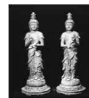
光久寺県宝「木造日光菩薩立像・月光菩薩立像」