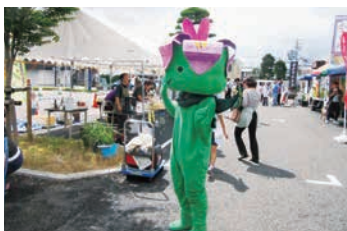
朝市に登場したリーリオ

ですが、明科を元気の活路ある街にと、リーリオTシャツの輪を広げ、新たな一歩を歩み出そうと思えます。