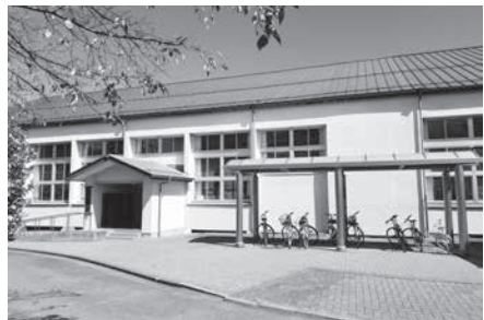
新総合体育館完成後、取り壊し予定の豊科武道館剣道場

問 新総合体育館が建てられた後、取り壊す事となっている豊科武道館剣道場は行政財産であるが、跡地を普通財産に切り替えることで、