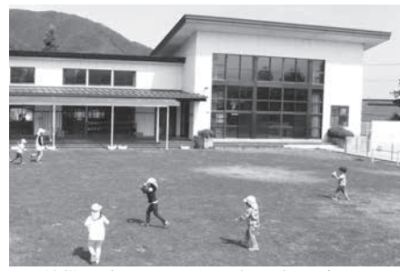
整備が待たれる三郷西部認定こども園

問 三郷東部認定こども園も41年経過し、老朽化、耐震性不足である。整備について早く方向性を出し、