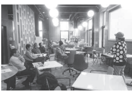
塩尻市のインキュベーション拠点「スナバ」 ※インキュベーションとは起業・創業支援のこと

問 次なる産業振興、仕事創出の一手として、まずイ拠点づくりをテーマにした研究会を作れないか。官