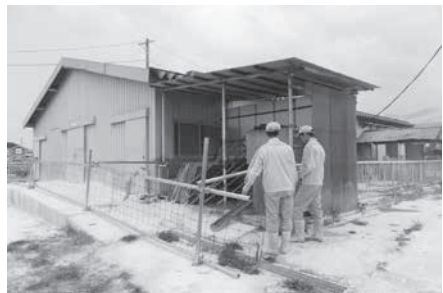
南安農芸高校の豚舎を囲む消石灰のバリケード

市長 評価は市民がするもので、自らすべきではない。水道料金の統一も理解を得られた。産業振興、健康長寿のまちづくりなど概ね順調に進んでいる。後半も公約を具現化する事業に、議会や市民の皆さんと更に安曇野づくりにまい進する。