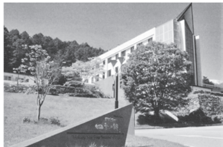
3期連続して経常損失が続く、早期赤字経営脱却に努めるほりでーゆ〜四季の郷

農林 令和4年度末に施設譲渡した場合の試算値で1億6800万円。(県や国でなく市の試算値)