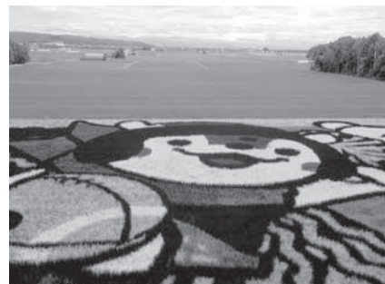
旭川市の田んぼアート

考察 本市もテレワーク事業が令和元年度から始まり、仕事が創出される。移住促進、インバウンド、ワーケーションなど多様な切り口で活力を生み出すソフト戦略のある拠点を本市も創っていくべきだろう。