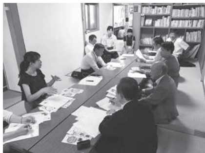
空き店舗を活用した支援施設での研修

日程 令和元年7月8日(月)～9日(火) 視察先 山口県山口市 目的 地域にある子育て支援施設の現状