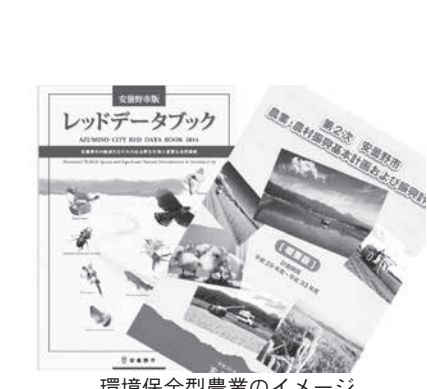
環境保全型農業のイメージ

問 農薬全体として減少でも、種類によっては増加している。ネオニコチノイド系農薬はこの10年間で4倍、グリホサート（商品名ラウン