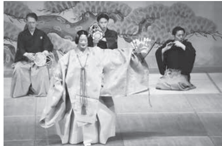
豊科公民館ホールで開催された能楽観賞会

ホールで開催されたが、本来は明科の龍門洞公園で「新能」として開催されていたもの。認定こども園建設工事の影響でやむを得ず屋内開催としているが、安曇野らしい野趣と本物に拘った「新能」として復活、継続すべきでは。