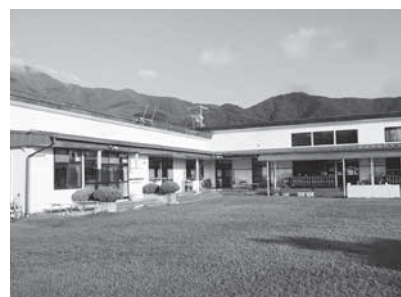
地域の宝、三郷西部認定こども園

市長 報告の基本理念は、民営化の検討でも大事。方向性は今後の対話により、現段階では結論付けられない。報告書には非常に感銘を受けた。