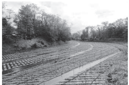
大王わさび農場（穂高） 観光資源を滞在型観光に活かす！