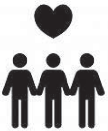
誰もが地域で当たり前暮らしを共生社会を目指して

※一般質問の詳細は、安曇野市議会ホームページまたは図書館に会議録があります。ご覧ください。(会議録作成には定例会から2カ月ほどかかりますのでご了承ください。)