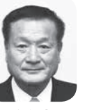
政和会 明 平林