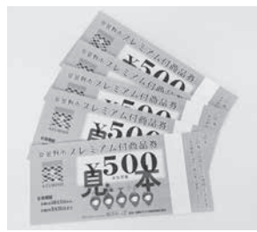
プレミアム付商品券

プレミアム付商品券は、低所得者など生活が大変な人へ手を差し伸べるもので、市内の消費拡大、活性化にも資するもの。