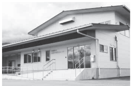
穂高地域の北部学校給食センター

※一般質問の詳細は、安曇野市議会ホームページまたは図書館に会議録があります。ご覧ください。（会議録作成には定例会から2カ月ほどかかりますのでご了承ください。）