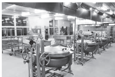
堀金学校給食センター

教長 現在のところ、向こう10年間の計画となる「公共施設再配置計画10年計画案」に学校給食センターの統廃合を盛り込むことは考えていない。できる限り、市民の皆さんと対話を続けていきたい。