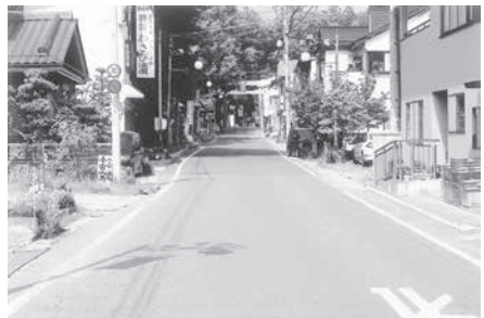
早期改良が望まれる！穂高神社表参道