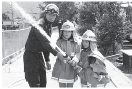
9月1日に行われた市総合防災訓練にて

※各議員のQRコードから一般質問の録画放送にリンクできます。ぜひご利用ください。(スマートフォン等でのご利用にはパケット通信料がかかります。)