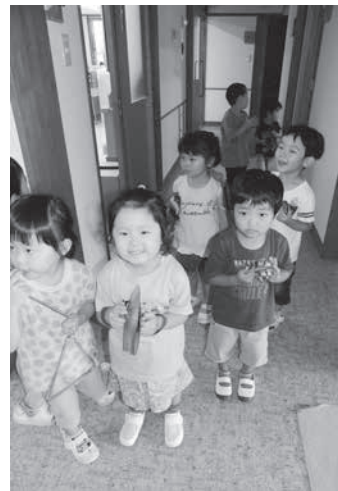
すくすく育て 安曇野っ子

① 「クラウドファンディング」とは 「資金調達(ファンディング)」を組み合わせた造語が「クラウドファンディング」で、インターネットを介して不特定多数の人々から少額ずつ資金を調達することを指す。今回本市では、新総合体育館建設という用途を明確にして、ふるさと寄附金を募集する。