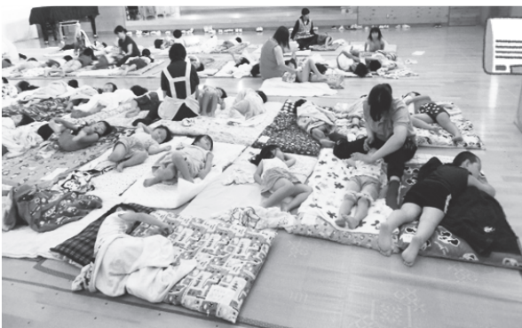
気持ちよくお昼寝できているかな？ (穂高幼稚園)