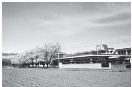
市費学校事務職員を引き上げた豊科東小学校