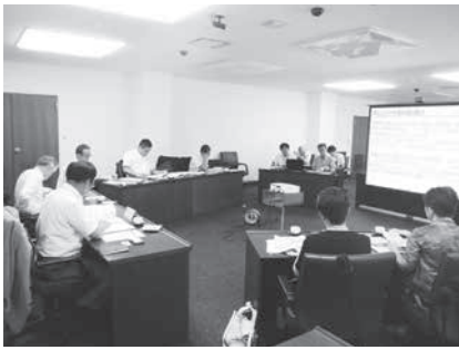
桑名市での議員研修

日程 令和元年8月5日(月)～6日(火) 視察先 滋賀県近江八幡市 目的 ゴミ処理施設の稼働と余熱利用 考察 余熱利用のプールが外観のみの視察ではあったが、後日、利用状