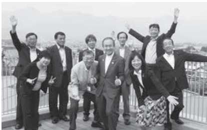
今期の広報委員会の卒業写真！