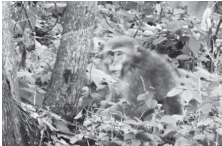
二ホンザルの被害額は3倍に急増

問 次なる産業振興、仕事創出の一手として、まずイ拠点づくりをテーマにした研究会を作れないか。官