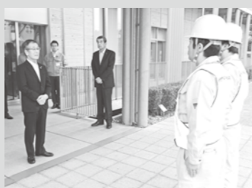
千曲市災害派遣出発式

県内被災地に対しましては、被災家屋被害認定調査や避難所の運営支援、被災ごみの回収作業などのため、長野市・飯山市・千曲市へ職員の派遣を行うなど、市をあげて被災地支援に取り組んでまいります。市役所本庁舎・各支所では義援金の受付も行ってまいりますので、皆さまのご協力を引き続きお願いいたします。