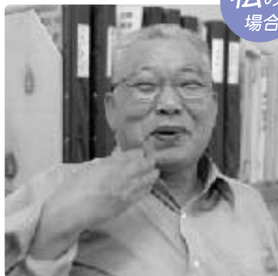
仲間の戦う姿 見ることができたのが良かった。