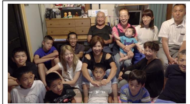
8ミリフィルム提供者への取材（8ミリフィルム試写会の時の様子）