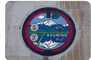
穂高駅前歩道に設置した蓋

市民の皆さんの下水道への更なる関心と下水道利用促進、併せて安曇野市の観光促進の一助になればと考えています。