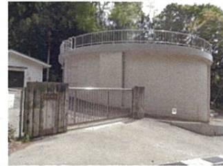
新光配水池 (PCタンク)

豊科明科地域整備事業が4年の歳月を経て完了しました。これにより、豊科犀川右岸地域の水源の確保、明科地域の施設の統廃合及び、管路の耐震化が図られ、災害時にも安定した水の供給ができるようになりました。