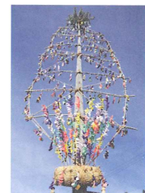
田尻南木戸の御柱(堀金)