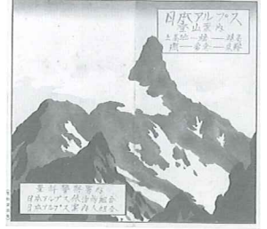
日本アルプス登山案内 日本アルプス案内人組合(昭和7年)