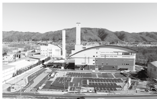
旧施設の隣接地に完成した新ごみ処理施設

同施設の運営は、エコサービスあづみ野(株)に委託し、3月1日から本格的に稼働を開始しています。