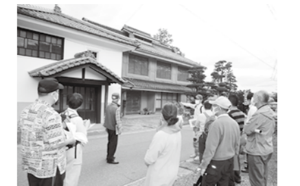
5月に開催した見学会の様子