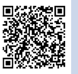
市HP ID 65297