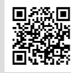
長野県飲食店CO2センサー等配布事業事務局HP