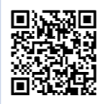
長野県新型コロナ中小企業者等特別応援金事務局HP