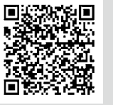
市HP ID 64749