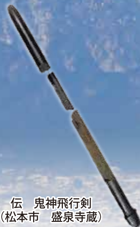
伝 鬼神飛行剣 (松本市 盛泉寺蔵)