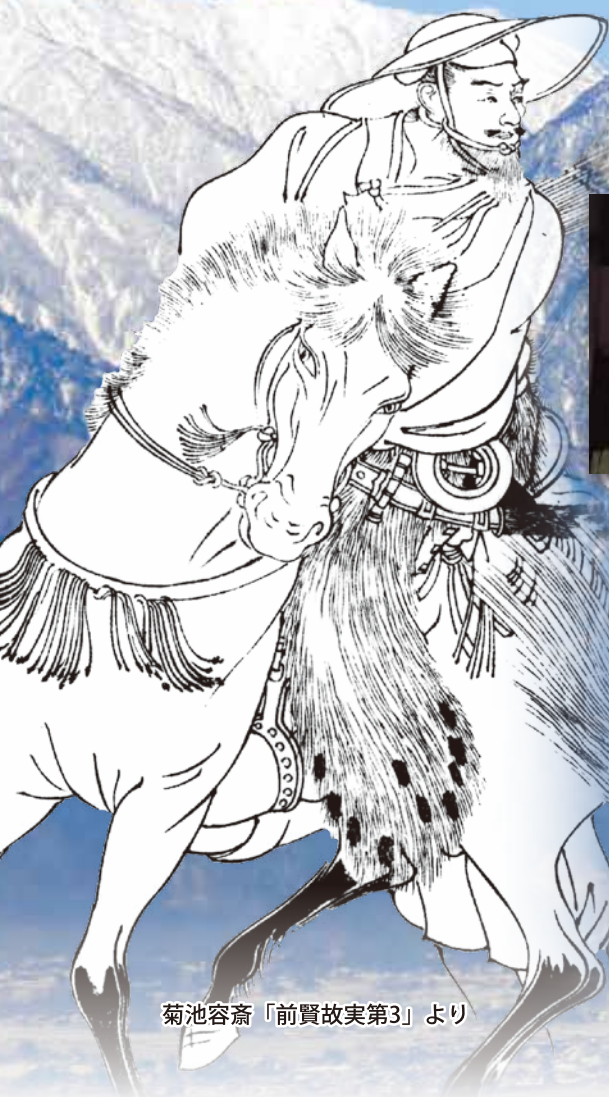
菊池容斎「前賢故実第3」より