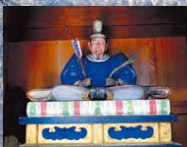
田村麻呂像 (松本市教育委員会蔵)