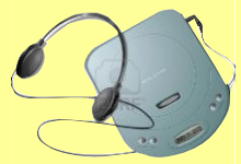
ポータブル音楽プレーヤー (MDプレーヤー・CDプレーヤーなど)