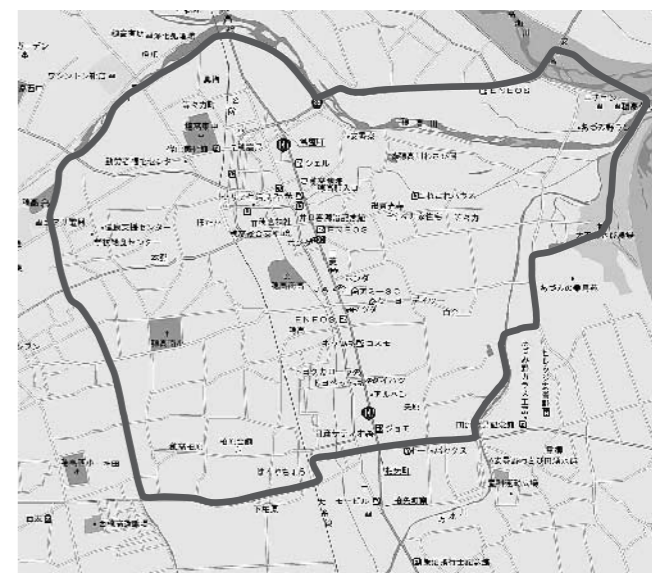
堀金で運行中のデマンド交通「うららカー」