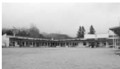
現在の有明保育園

■穂高健康支援センター内児童保育課 (TEL81・0728 FAX81・0703)