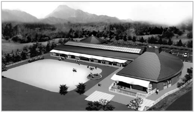
有明保育園完成イメージ