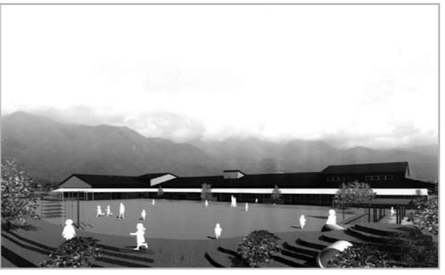
（仮称）有明分園保育園完成イメージ