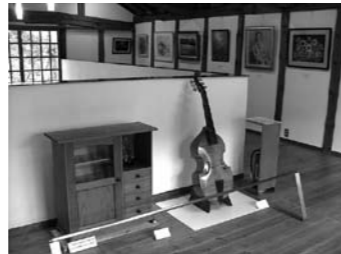
昨年度展示会のようす