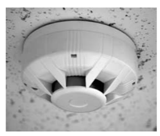
火災警報器のイメージ 一般住宅、共同住宅の寝室、台所、階段の2階部分へ設置します。

住宅火災による死者は高齢者が多く、逃げ遅れが主な原因です。火災は早期発見が第一。室内の煙に反応して大きな音で知らせる住宅用火災警報器の1日も早い設置をお願いします。新築住宅はすでに設置が義務付けられています。平成18年6月1日以前に建てられた住宅についても平成21年6月1日までに設置するよう法律で定められています。詳しくは最寄りの消防署へおたずねください。 問 豊科消防署 (TEL72・3145) 穂高消防署 (TEL82・3262) 梓川消防署 (TEL78・2090) 明科消防署 (TEL62・2992)