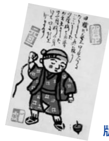
版画でつくった年賀状