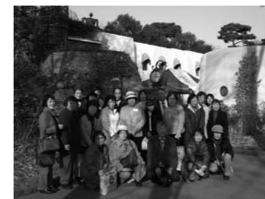
ジブリ美術館にて