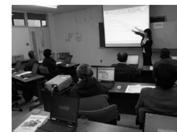
パソコン教室のようす